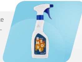
BO7710001 6 X 0.5 L/CAJA

Mactac Remover es una solución muy potente para eliminar restos de adhesivo de las superficies. Su fórmula específica permite una limpieza excelente y rápida de las superficies tras la retirada de productos autoadhesivos. Disponible en spray de 500 ml.