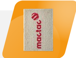
EB8890002 100 PIEZAS/CAJA

Mactac Felt Squeegee es una espátula de fieltro suave, diseñada para evitar rayar la superficie del material durante la aplicación de productos autoadhesivos. Está especialmente recomendada para la aplicación de laminados y de productos de rotulación.