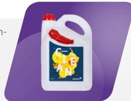
BO7680001 6 X 975 ML/CAJA BO7660001 4 X 4 L/CAJA

Mactac Cleaner es un limpiador de alto rendimiento diseñado para eliminar la grasa de varios tipos de superficies antes de la aplicación de un film autoadhesivo. Elimina los residuos más habituales (como la suciedad, la cera, etc.) así como la contaminación diaria, cuando se está preparando la aplicación de un film sobre una superficie. Su práctico envase en spray es muy fácil de rellenar. Disponible en spray de 975 ml y en un depósito de 4 litros para rellenar.