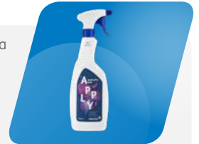
BO7650001 6 X 975 ML/CAJA BO7670001 4 X 4 L/CAJA

Mactac Application fluid está diseñado para ayudar en las aplicaciones en mojado de varios materiales de Mactac sobre los cristales o para la aplicación de los films de protección de carrocerías. Se ha comprobado su compatibilidad con los productos más comunes disponibles para aplicaciones de films en cristales y en carrocerías. Disponible en una botella con dosificador de 975ml y una lata de rellenado de 4litros.