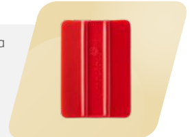
EB8860002 100 PIEZAS/CAJA

Mactac Squeegee Europe es una espátula roja de plástico flexible, apta para la aplicación de materiales autoadhesivos sobre superficies planas y curvas.