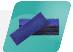
BR8340001 500 PIEZAS/CAJA

Las Mactac Squeegee Strips son unas tiras protectoras suaves y autoadhesivas diseñadas para ser aplicadas en los bordes de las espátulas. Son fáciles de poner y permiten aplicaciones de mayor calidad, facilitan el deslizamiento y protegen el vinilo de arañazos y rayaduras.