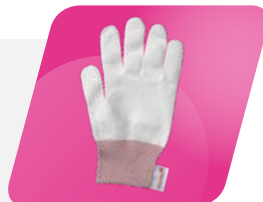
BQ0810001 100 PIEZAS/CAJA

Mactac Glove es un guante blanco de algodón diseñado para su uso durante la aplicación de materiales autoadhesivos. Su sencillo diseño permite que el Mactac Glove se deslice con facilidad sobre toda la superficie para facilitar la aplicación.