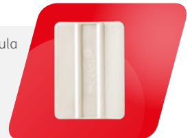
EB8870001 100 PIEZAS/CAJA

Mactac White Squeegee PA es una espátula blanca de plástico rígido, apta para la aplicación de materiales autoadhesivos sobre superficies planas y curvas.