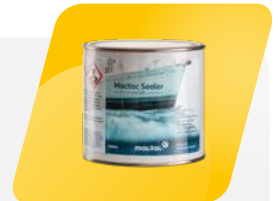
BP2540001 6 X 500 ML/CAJA

Mactac Sealer es un sellante de bordes duradero e incoloro que se adhiere a diferentes superficies (p. ej., acero, cristal, pintura o vinilo). Se utiliza para sellar los bordes en aplicaciones náuticas u otras con alto riesgo de vertido de productos químicos. El Mactac Sealer evita que se levanten los bordes en las aplicaciones más exigentes y se puede utilizar con una gran variedad de productos gráficos de Mactac. Disponible en una lata de 500 ml.