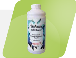
EB8910002 6 X 1 L/CAJA

Mactac TagAway es un líquido diseñado para eliminar los grafitis y la pintura de spray de forma efectiva de los materiales autoadhesivos aplicados. Disponible en botellas de 1 litro.